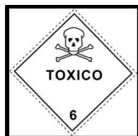
Rótulo peligro principal

Distintivo según NCh2190: Sustancias tóxicas (Clase 6, División 6.1)